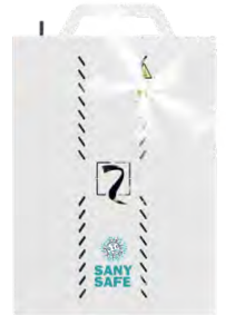
SANY SAFE L MOBIL