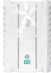
SANY SAFE XL

SANY SAFE L deckt ein Raumvolumen von ca. 20 m 3 bis 300 m 3 ab und steht zusätzlich als tragbare Version mit praktischem Handgriff zur Verfügung (SANY SAFE L MOBIL).