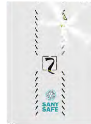
SANY SAFE L